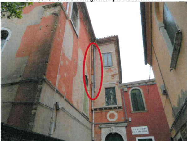
Canne fumarie e comignoli in presunto amianto