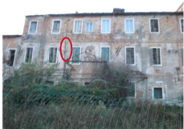
Canne fumarie e comignoli in presunto amianto