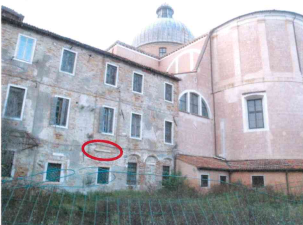
Canne fumarie e comignoli in presunto amianto