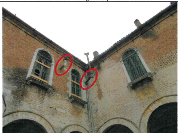
Canne fumarie e comignoli in presunto amianto